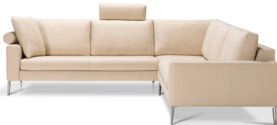
CASTELL II MODELL 9132